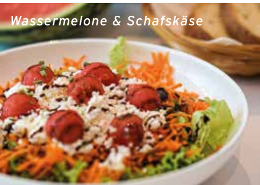
Wassermelone & Schafskäse