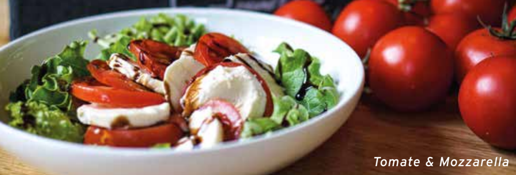
Tomate & Mozzarella